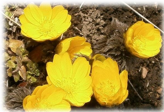
福寿草(フクジュソウ)