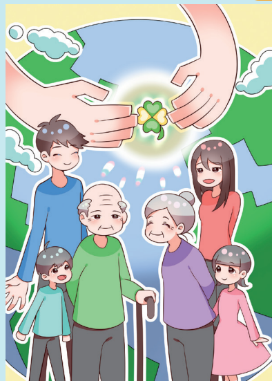
*本イラストのデザインは、大阪アニメーションスクール専門学校のご協力によって制作されたものです。