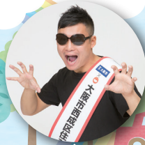
吉本住みます芸人「カオ〜ちゃん」も来るよ