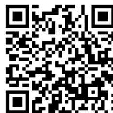
申込ページ QR コード