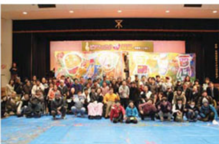
「ピアフェスタ in 城東」の様子