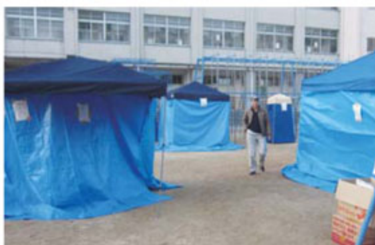
防災訓練での仮設トイレ