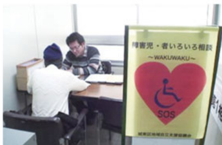
障がい児・者いろいろ相談窓口「WAKU WAKU」

『気になり寝付けない』、また、リアリティをできるだけ追求した本格的な訓練だったこともあり『災害があったときの行動が想像できた』『障がいごとの問題などが参加者と共有できた』など、障がい者理解にもつながったと自負しています」