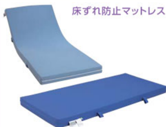
床ずれ防止マットレス