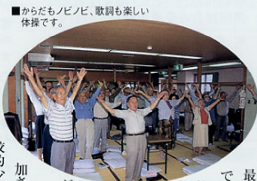
■からだもビノビ、歌詞も楽しい体操です。

最後は、軽いリフレッシュ体操です。「365歩のマーチ」の替え歌による「健康体操」。