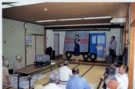
■皆さん熱心に婦警さんのお話を聞いています。

その時の状況を説明する舞台には、婦警さん手作りの実物大の軽トラックが用意されています。この陰に人が隠れると、走行中のドライバーから見えにくいことがよくわかります。会場は参加者の意見も交えながら、和気あいあいとした雰囲気でした。