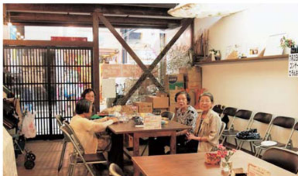
「エフ・エーサロン」は木材を多く使い、昭和の雰囲気を出しています

活動の目的や考え方に共鳴し、中心となって動けるスタッフが3人位は必要です。そして、利用者や地域をよくするためにやりがいを持って動ける人を探します。また、看護師や介護士等の専門職のサポートが得られれば心強いでしょう。