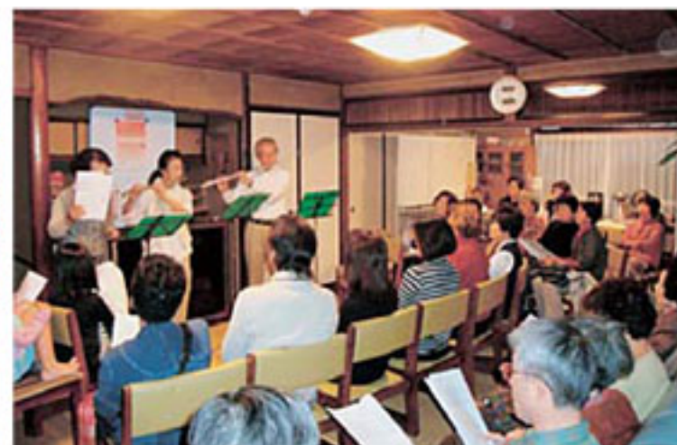
サロンで開催した「たそがれコンサート」の風景