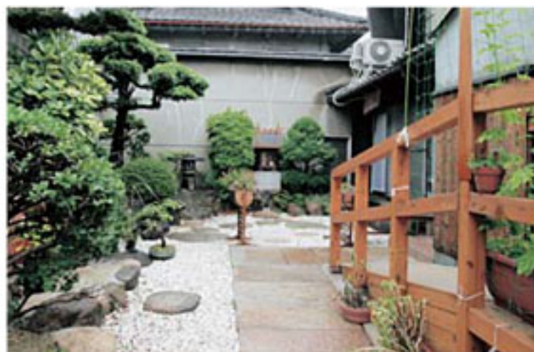
デイサービス利用者は右側のスロープから入ります