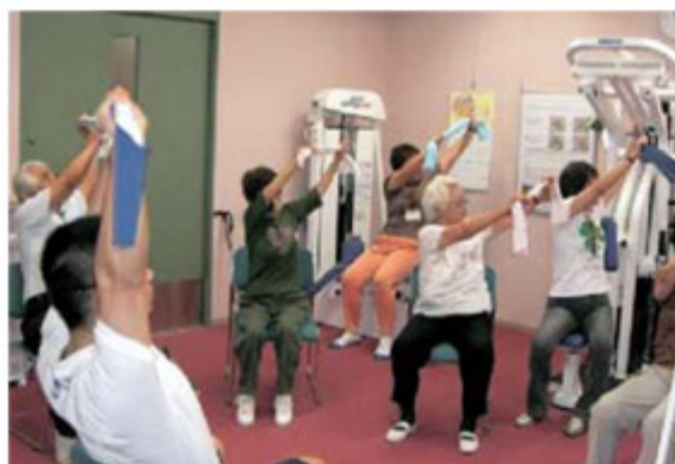
▲介護予防教室の様子

※教室に通うことが困難な方には、保健師等の専門職がご自宅にうかがい、個別の状態に合わせた生活機能向上の支援を行います。