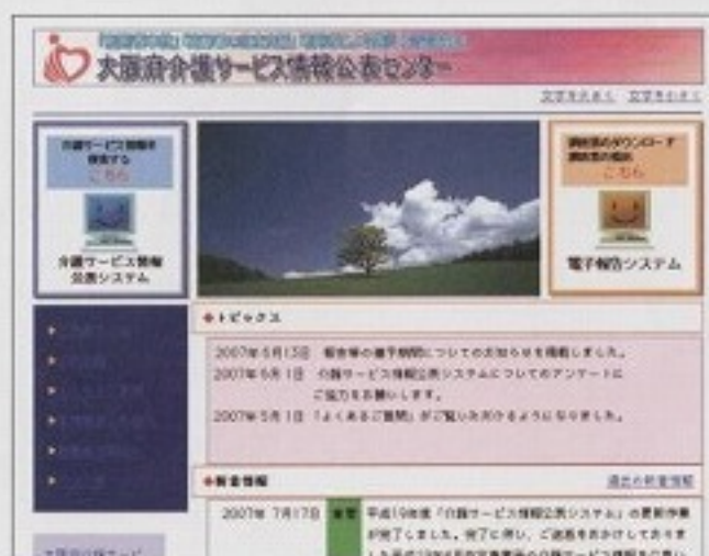
▲ホームページから検索できます

この制度が導入され、利用者は事業所を適切に選択することが可能になるとともに、事業所はサービス改善への取り組み及び利用者の支持を得るため、サービスの質の向上を図ることが期待されています。