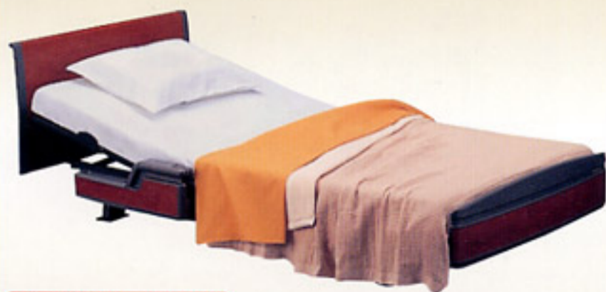
介護保険レンタル対象