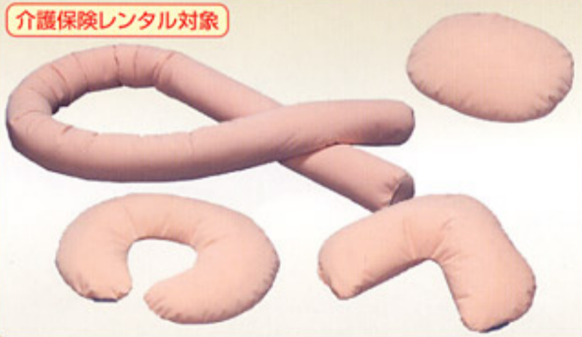
介護保険レンタル対象

腰から膝の床板を短くして、従来サイズのベッドが合わなかった小柄な方に理想的にフィットします。