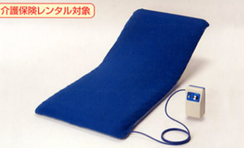
介護保険レンタル対象