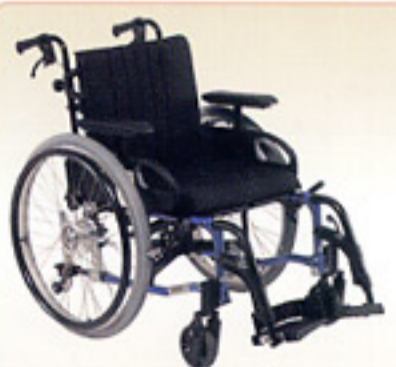
介護保険レンタル対象

世界初の折りたたみ式リジェットシート型モジュール車いす。左右個別の座奥調整が可能。ため片足こぎの方にも使用しやすい構造。各部調整も六角レンチ1本で調節可能です。