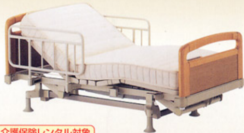
介護保険レンタル対象

体のズレ・姿勢のくずれ・圧迫感が少ない理想的な動作を1ボタンで実現する「らくらくモーション」搭載。新機能「操作履歴」ではベッドの使用状況が確認でき、ベッドの使い方やケアに関する助言に役立ちます。