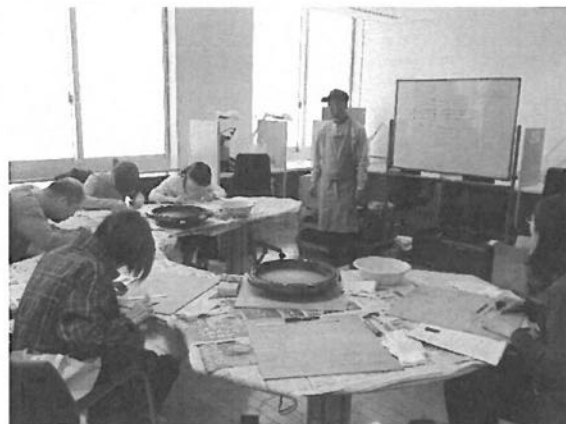
自助具制作体験講座

大阪府肢体不自由者協会・自助具の部屋と連携した「自助具製作体験講座」を2回実施し、実際の製作体験を通して自助具の理解を深めた。