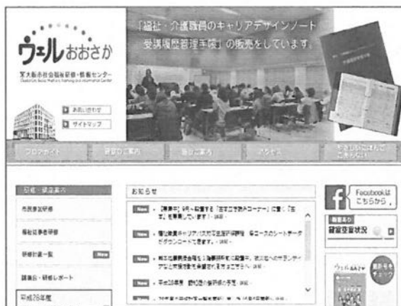
ホームページトップ画面