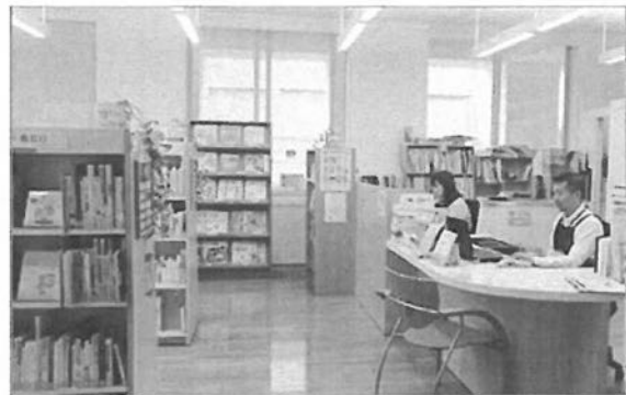
2階の図書・資料閲覧室

福祉関係図書・視聴覚資料(DVD・ビデオ)等の収集・貸出を行っており、約40,000点(図書約16,500点、雑誌及び紀要約12,000点、資料約9,500点、視聴覚資料約2,000点)を所蔵している。貸出希望の多いDVDはさらなる収集を進め、毎月の新着図書・DVDリストの作成、16分野別の図書・DVD紹介リストを作成し配布した。また、1階エントランスにて「古本立ち読みコーナー」の開設や「リサイクルブックフェア」イベントを行うなど図書・資料閲覧室利用について周知を行った。