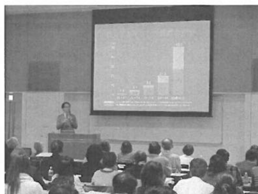
市民のための認知症介護講演会

認知症の医療的な知識及びケアについて学ぶ講演会であり、非常に多くの受講者が参加し好評を得た。